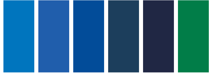
178 AA S2 □ Cobalt Blue Bleu de Cobalt Azul de Cobalto 179 A S1 ■ Cobalt Blue Hue Nuance de Bleu de Cobalt Tono de Azul de Cobalto 263 A S1 □ French Ultramarine Outremer Français Ultramar Azul 514 A S1 □ Phthalo Blue (Red Shade) Bleu de Phthalo (Nuance Rouge) Azul Ftalo (Matiz Rojo) 538 A S1 □ Prussian Blue Bleu de Prusse Azul de Prusia 521 A S1 □ Phthalo Green (Yellow Shade) Vert Phthalo (Nuance Jaune) Verde Ftalo (Matiz Amarillo)