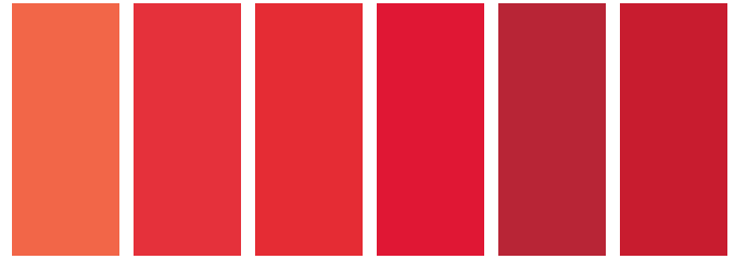
090 A S1 □ Cadmium Orange Hue Nuance de Cadmium Orange Tono de Cadmio Naranja 100 A S2 ■ Cadmium Red Light Rouge de Cadmium Clair Rojo de Cadmio Claro 099 A S2 ■ Cadmium Red Medium Rouge de Cadmium Moyen Rojo de Cadmio Medio 095 A S1 □ Cadmium Red Hue Nuance de Rouge de Cadmium Tono Rojo de Cadmio 104 A S2 ■ Cadmium Red Dark Rouge de Cadmium Foncé Tono Rojo de Cadmio Oscuro 098 A S1 □ Cadmium Red Deep Hue Nuance de Rouge de Cadmium Foncé Tono Rojo de Cadmio Oscuro