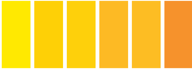
346 A S1 □ Lemon Yellow Jaune Citron Amarillo Limón 113 A S2 ■ Cadmium Yellow Light Jaune de Cadmium Clair Amarillo de Cadmio Claro 119 A S1 □ Cadmium Yellow Pale Hue Nuance de Jaune de Cadmium Pâle Tono Amarillo de Cadmio Pálido 116 A S2 ■ Cadmium Yellow Medium Jaune de Cadmium Moyen Amarillo de Cadmio Medio 109 A S1 □ Cadmium Yellow Hue Nuance de Jaune de Cadmium Tono Amarillo de Cadmio 115 A S1 □ Cadmium Yellow Deep Hue Nuance de Jaune de Cadmium Foncé Tono Amarillo de Cadmio Oscuro