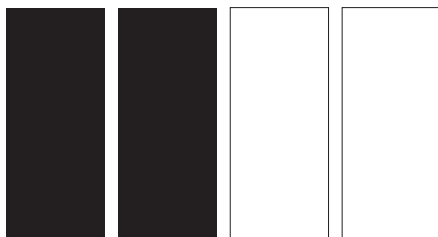
331 AA S1 ■ Ivory Black Noir d'Ivoire Negro de Marfil 337 AA S1 ■ Lamp Black Noir de Fumée Negro de Humo 644 AA S1 ■ Titanium White Blanc de Titane Blanco de Titano 748 AA S1 ■ Zinc White (Mixing White) Blanc de Zinc (Blanc Pour Mélanges) Blanco de Zinc (Blanco Para Mezclas)