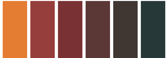
552 AA S1 □ Raw Sienna Terre de Sienne Naturelle Tierra de Siena Natural 317 AA S1 ■ Indian Red Rouge Indien Rojo Indio 074 AA S1 □ Burnt Sienna Terre de Sienne Brûlée Tierra de Siena Tostada 076 AA S1 □ Burnt Umber Terre d'ombre Brûlée Tierra de Sombra Tostada 554 AA S1 □ Raw Umber Terre d'ombre Naturelle Tierra de Sombra Natural 465 A S1 ■ Payne's Gray Gris de Payne Gris de Payne